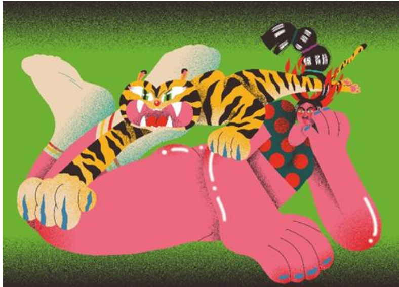
Genie Espinosa. Portada para LÖK zine número 12. Cortesía de la autora